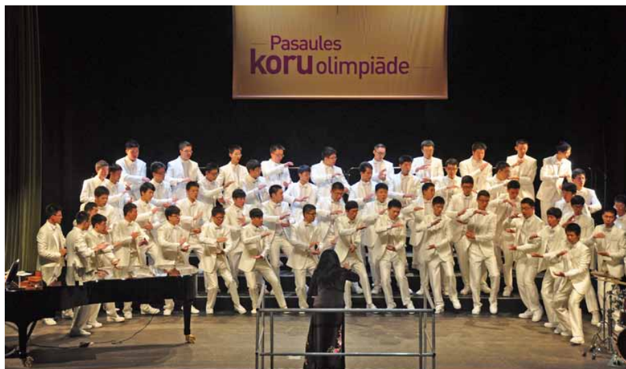
SHANGHAI YANGJING HIGH SCHOOL MEN'S CHOIR People's Rep. China, Shanghai