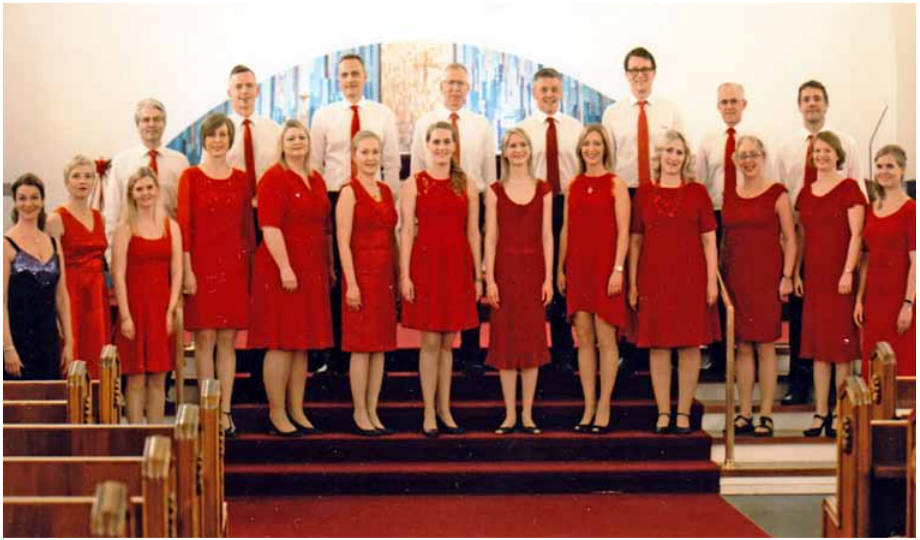
SPECTRUM Iceland, Reykjavik