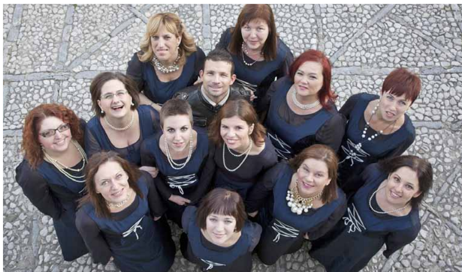
FEMALE VOCAL ENSEMBLE "KLAPA KASTAV"