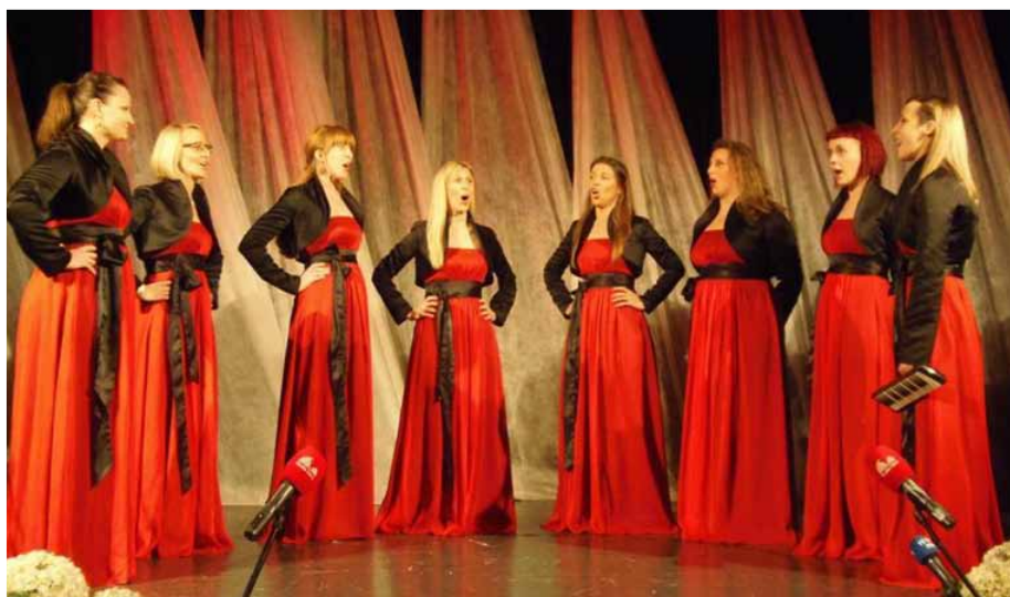
ŽENSKA KLAPA TERANKE