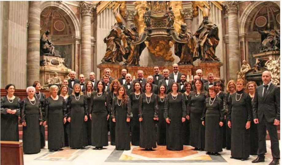
CORALE VALDERA Italy, Peccioli (PI)