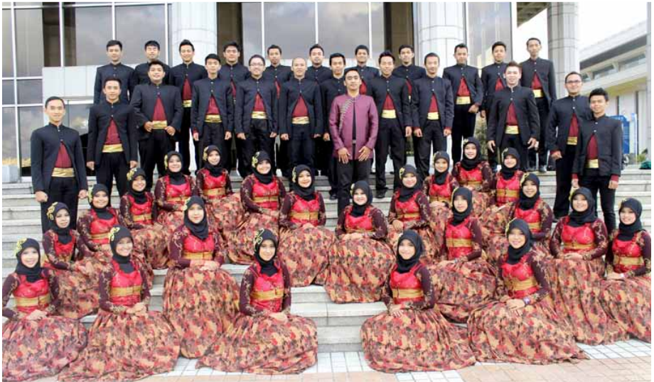
GITASURYA STUDENT CHOIR UNIVERSITY OF MUHAMMADIYAH MALANG Indonesia, Malang