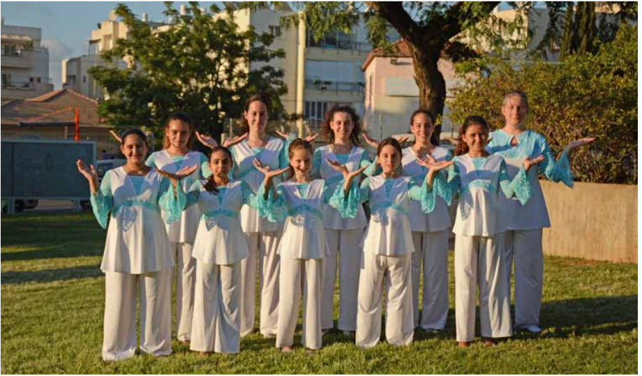
LI - RON CHOIR Israel, Herzliya