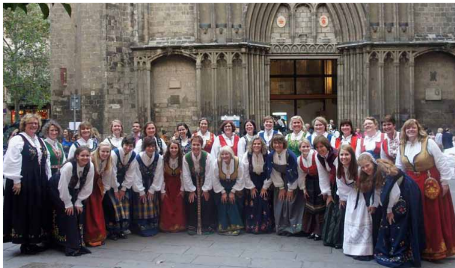
CALDERA Norway, Oslo