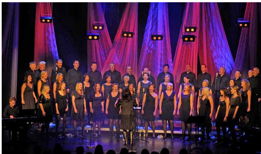
VON DESS Norway, Ålesund