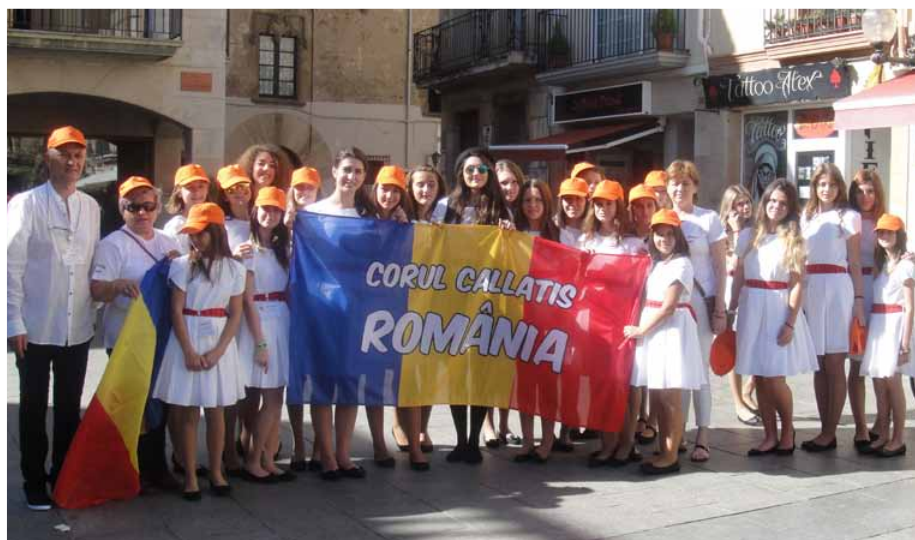
CORUL DE COPII "CALLATIS" Romania, Mangalia